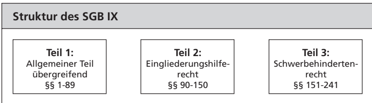
Abbildung 1: Struktur des BTHG

Der Artikel 1 des Artikelgesetzes umfasst die Neufassung des SGB IX in drei Teilen.