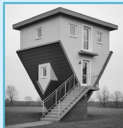
Abb. 2: Haus auf dem Kopf (ChatGPT 5.1)

Warum denken wir das eine, warum das andere? Was ist Normalität und wie wird sie hergestellt?